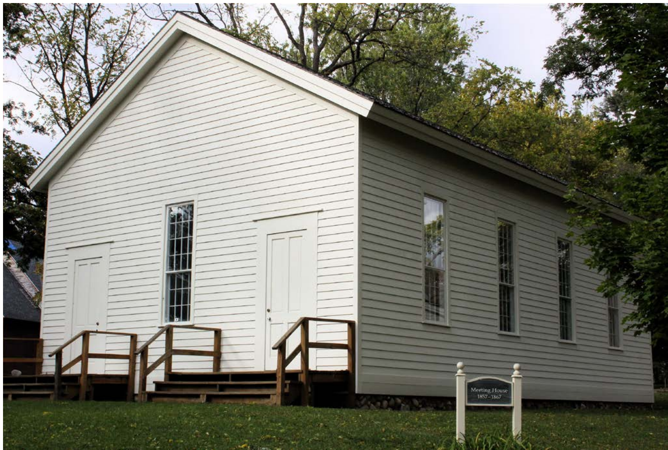
Современная реплика исторического здания Второй церкви в Бэтл-крик, где состоялось первое заседание Генеральной конференции 1863 года, на котором была создана организация Адвентистов седьмого дня