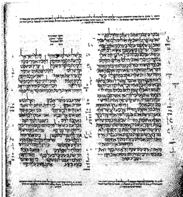
Факсимиле книги Притчей из Ленинградского кодекса (1008 г. н. э.)

ратили мысли водящиеся этим мнением, и потому значительно погрестили против истины, иначе, нежели как требует в этом месте Божественное и Пророческое Писание, поняв эти слова: «Господь созда Мя начало путей Своих» (Прит. 8:22 LXX). Не одно, как знаете, значение слова: «созда». «Созда» здесь должно принять вместо: «поставил» над делами, Им сотворенными и сотворенными чрез самого Сына. Но не в значении: «сотворил» употреблено теперь слово «созда»; потому что есть разность в словах: «сотворить» и «создать». «Не сами сей Отец твой стяжа тя, и сотвори тя, и созда тя», — говорит Моисей в великой песни во Второзаконии (Втор. 32:6 LXX)? И им скажет иной: какие безрассудные люди! Ужели тварь — Первороденный «всяя твари» (Кол.1:15), Рожденный «из чрева прежде денницы» (Пс. 109:3 LXX), как Премудрость, Изрекший: «прежде всех холмов рождает Мя» (Прит. 8:25 LXX)? И во многих местах Божественных Словес найдется всякий, что Сын называется рождением, а не сотворенным, и этими местами ясно изобличаются составляющие ложные понятия о Господнем рождении и осмеливающиеся Божественное и неизреченное рождение Его называть творением 15 .