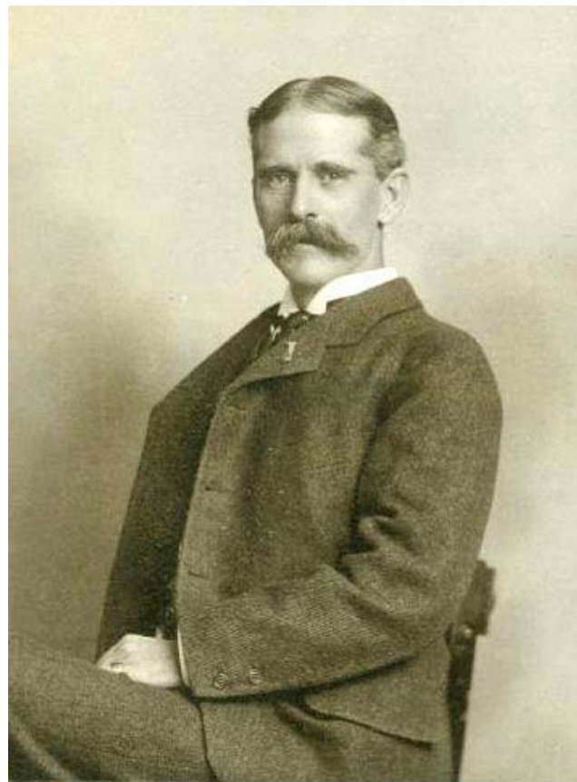
Генри ван Дайк

Сегодняшнее мышление смерти Бога таким же образом символично. Священное Писание тоже говорит о смерти, но Библия делает упор на смерти человека: «Ибо возмездие за грех — смерть, а дар Божий — жизнь вечная во Христе Иисусе, Господе нашем» (Рим. 6:23). Писание описывает предсмертную агонию человечества, а не Бога. А когда Бог действительно