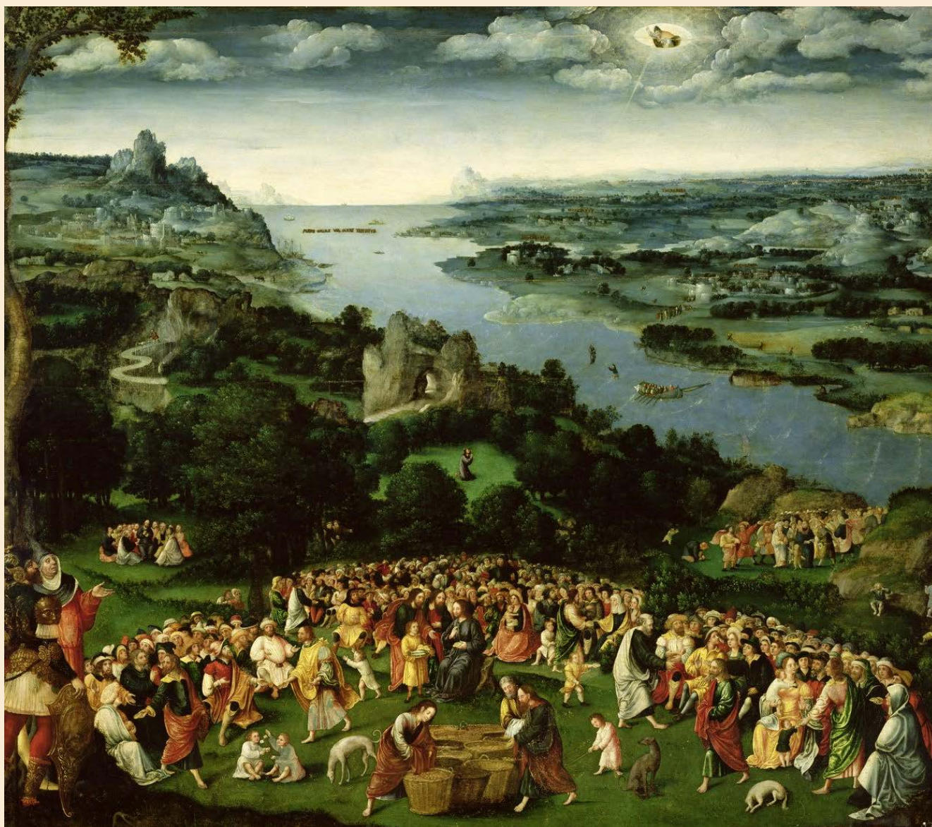
Иоахим Патинир. Насыщение пяти тысяч

больными. Иисус взшел на гору и там сидел с учениками Своими. Приближалась же Пасха, праздник Иудейский. Иисус, возведя очи и увидев, что множество народа идет к Нему, говорит Филиппу: где нам купить хлебов, чтобы их накормить? Говорил же это, испытывая его; ибо Сам знал, что хотел сделать. Филипп отвечал Ему: им на двести динариев не довольно будет хлеба, чтобы каждому из них досталось хотя понемногу.