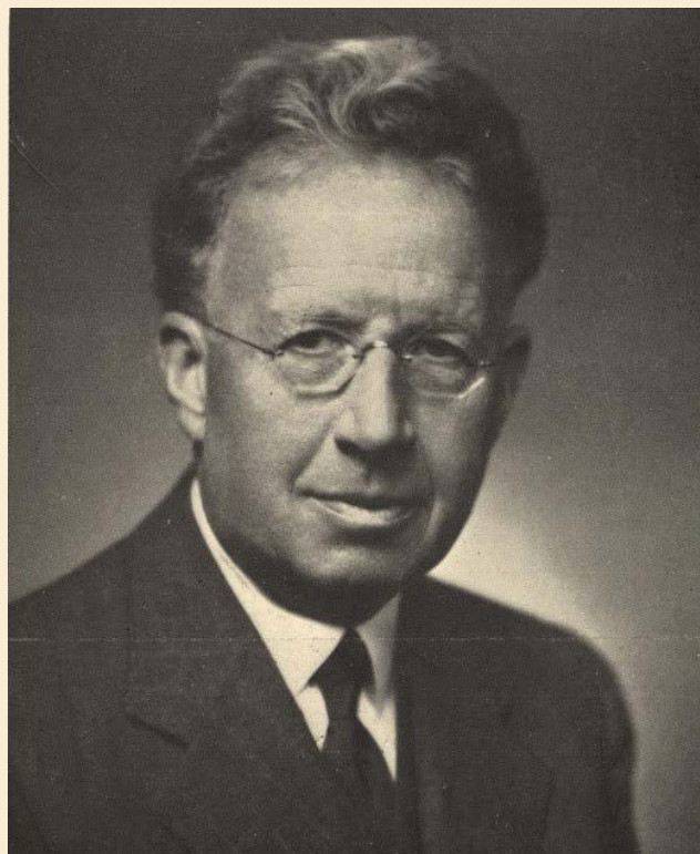
Д-р Гарри Эмерсон Фосдик (1878-1969)

Не следует забывать и о том, что в Библии нам открыты глубины Божии. Конечно, они лежат за пределами нашего понимания. Мы не можем удовлетворительно понять даже такие вещи, как пространство и время; тем менее мы способны уразуметь первопричину всего, личностную причину, нашего великого Бога. И дело тут не в Библии, это затруднение заложено в самой природе того, о чем идет речь. Простого христианина, верящего Библии, это нисколько не беспокоит до тех пор, пока он читает Книгу доверчивыми глазами Божьего ребенка.