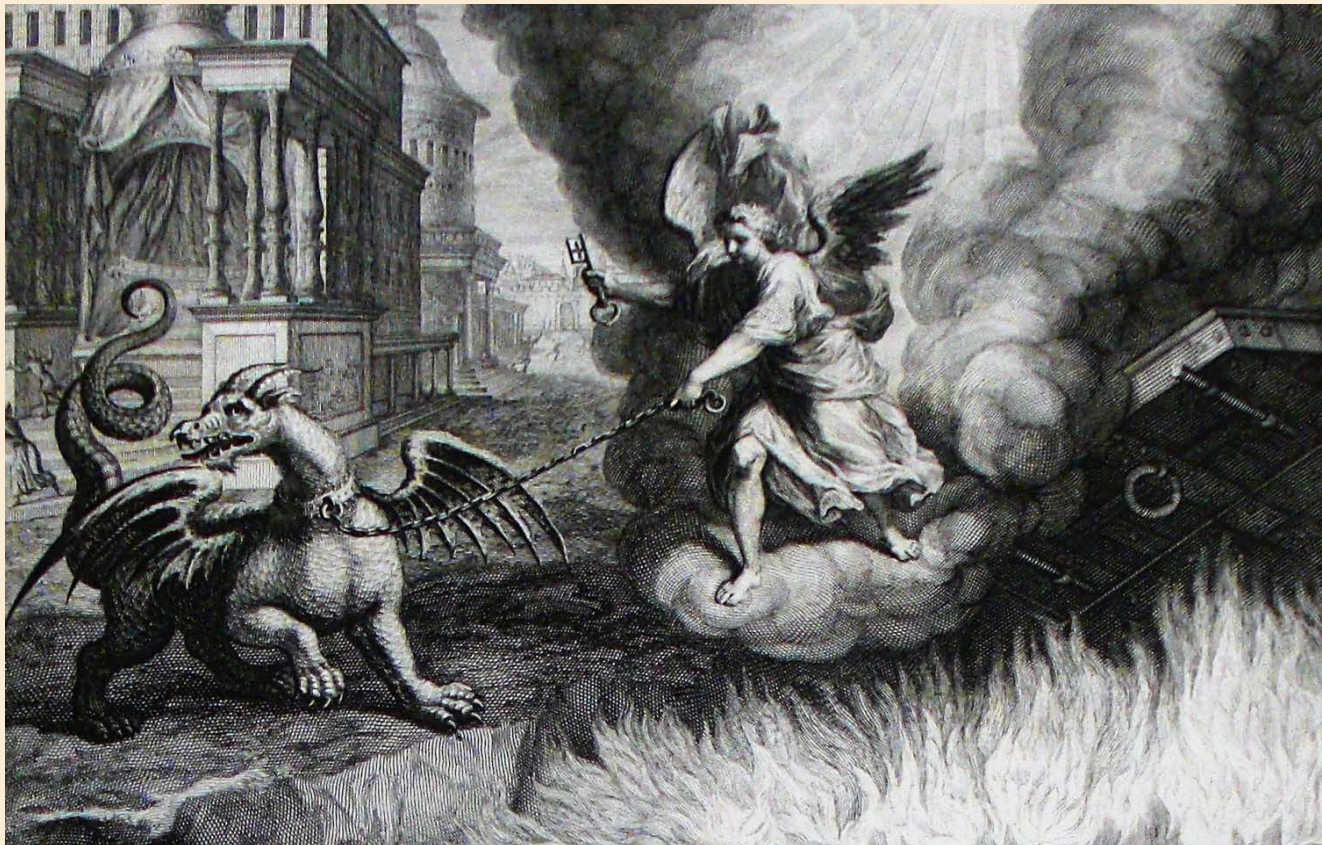
Изображение ангела с ключами от бездны из Библии с иллюстрациями, напечатанной Пьером Мортье

о которых идет речь, находились в гробах, а их души — на небесах. Душа — та часть нашего существа, которая переживает момент смерти, она бессмертна. Другие слова, употребленные здесь, тоже было бы полезно изучить, однако время не позволяет нам сейчас этим заняться.