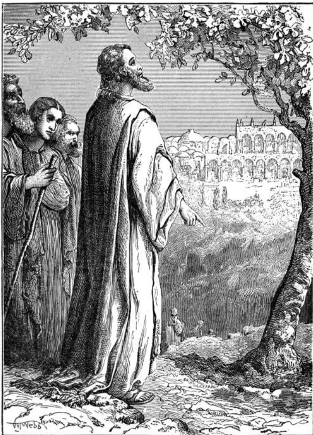
Иисус проклиная смоковницу

и Илия — также имеют значение, поскольку именно они в Ветхом Завете хотели «увидеть» Бога. Однако в обоих случаях Бог явился им не в полноте Своей славы: Моисей прятался в расщелине скалы и смог увидеть Бога лишь со спины (Исх. 33:22-23), а Илия увидел лишь знамения Его присутствия (3 Цар. 19:11-12). В 9-й главе Марка Моисей и Илия уже не прячутся, но свободно общаются с Иисусом.