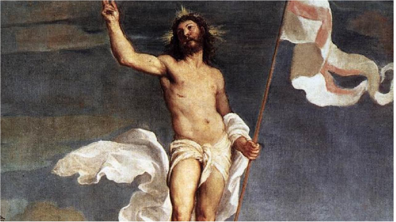
Тициан. Воскресение (фрагмент)