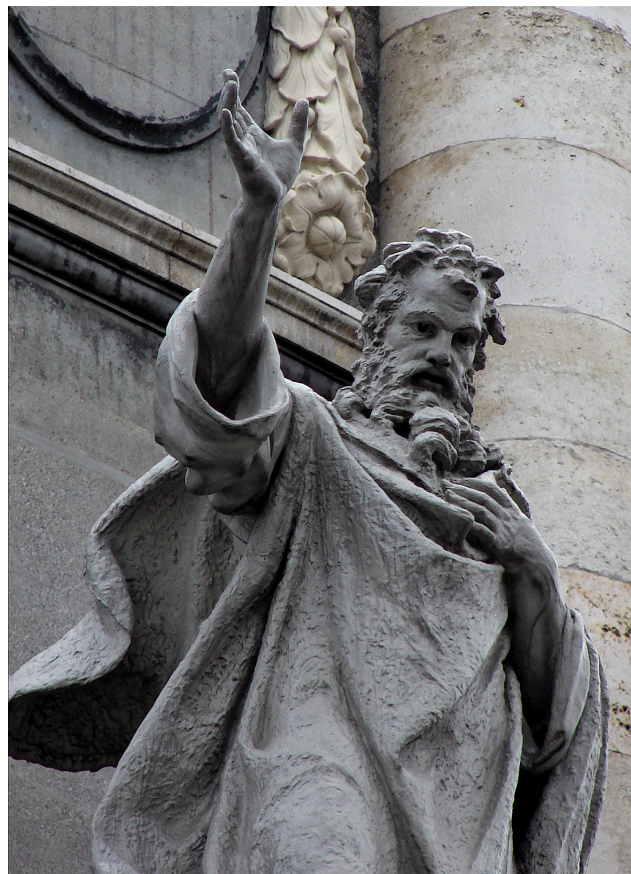
Иринеи Лионский (Мраморная церковь, Копенгаген)

Вопреки традиционному учению Рор утверждает, что «первое воплощение» произо-