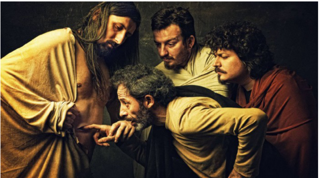
Караваджо. Неверие Фомы

Почему Иисус вдруг решил поесть? Именно для того, чтобы доказать ученикам, что Он — не дух. Ведь духи не едят!