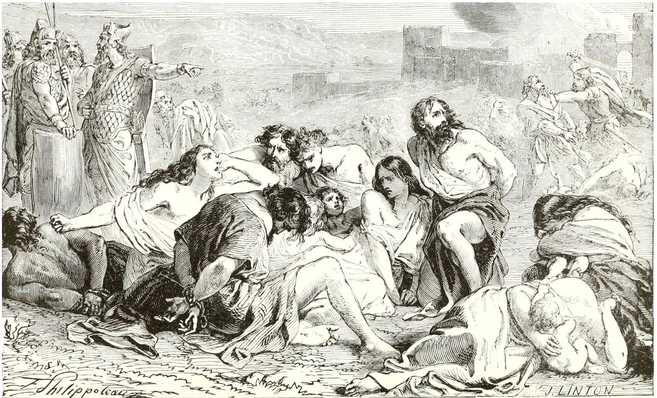
EXTERMINATION OF CANAANITES.—Drawn by F. Philpoteaux.

Феликс-Эмманюэль-Анри Филиппото (1815-1884). Истребление хананеев (эстамп)