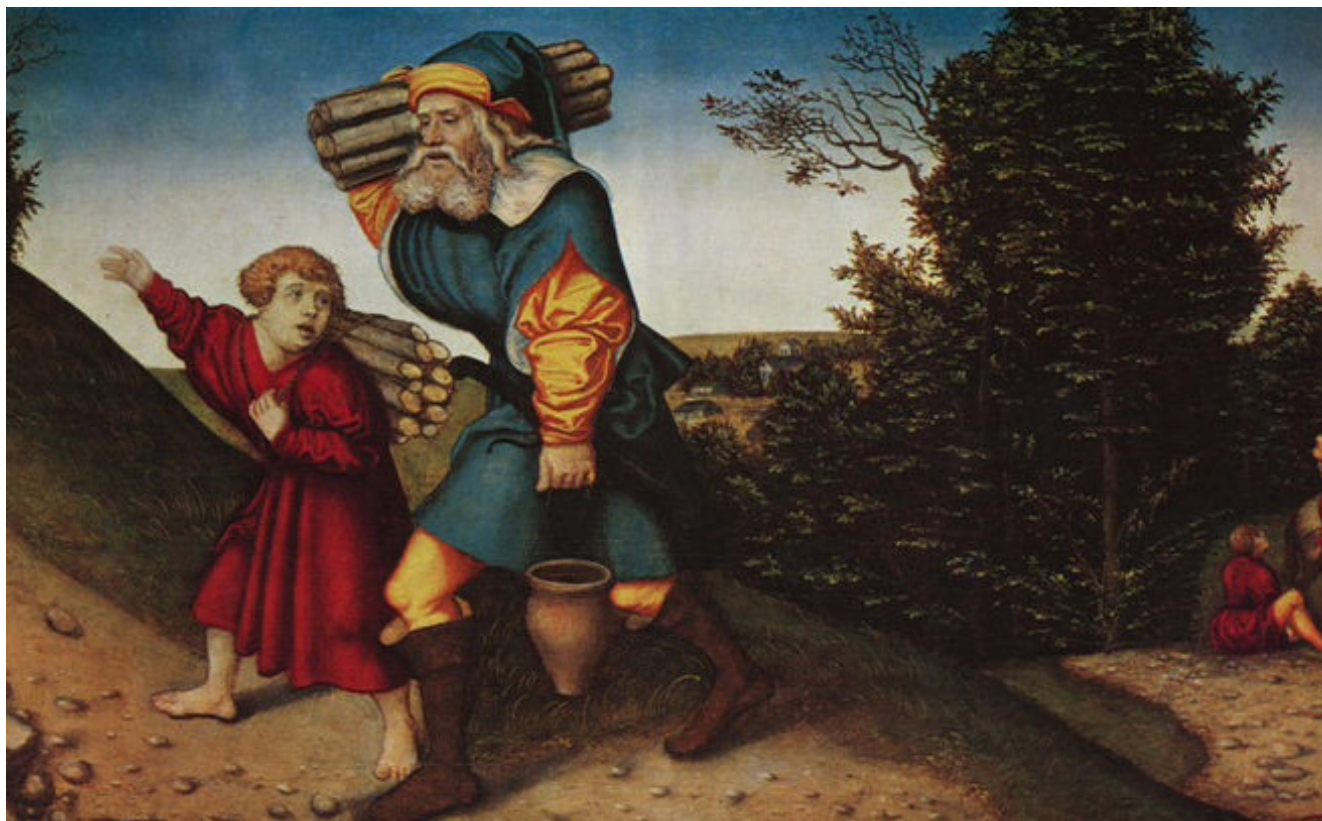
Лукас Кранах Старший. Авраам и Исаак [на пути к жертвеннику] (доска, масло, ок. 1630)

во звучит голос скептика, который возражает: «Отлично, но что мешает тебе сказать: „Бог велел мне убить этого человека“ или „Бог велел мне сделать то-то и то-то“, — словно Бог велел тебе творить любые бесчинства, какие только взбредут в голову?» Итак, что бы Вы ответили скептику, который спрашивает: «Что мешает Богу приказать то-то и то-то?»