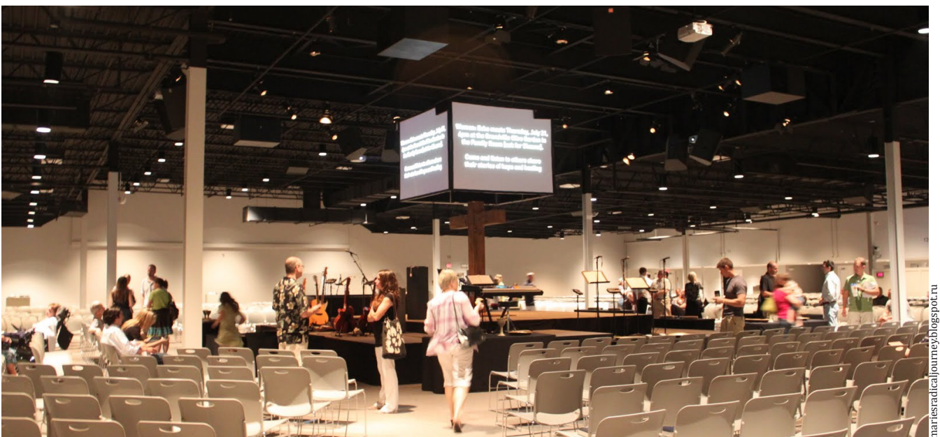
Интерьер церкви «Марс Хилл»

Перемены в мировоззрении Белла достигли переломной точки в 2011 году с выходом в свет его книги под названием «Любовь побеждает» ( Love Wins ). Она вызвала жаркие споры, поскольку в ней Белл открыто ставит под сомнение вечную участь неверующих. Он довольно туманно рассуждает о том, что, хотя неверующие пребывают в аду и сейчас, и после смерти, у них все равно остается возмож-