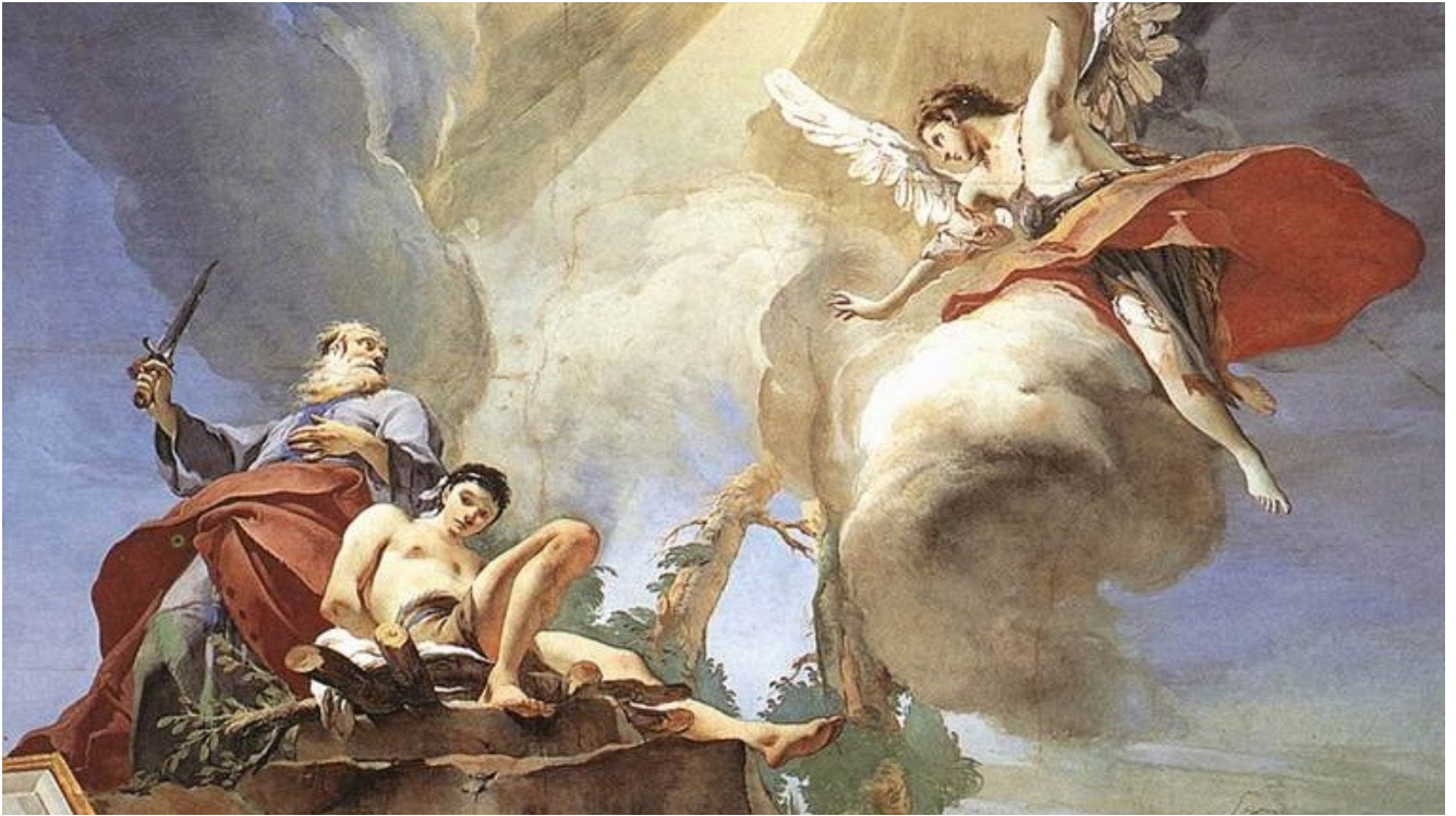
Джованни Баттиста Тьеполо. Принесение в жертву Исаака (фреска, 1726-1728)

тянулось, но патриарх больше не хочет ждать Божьей помощи, он вступает в сговор с Сарой, и в результате его плотской связи с Агарью (которую организовала все та же Сара) на свет появляется Измаил. Естественно, Аврам полон надежд: «Это будет обещанный ребенок. Пусть Измаил ходит перед Господом. Пусть он будет исполнением обещания». Но Бог отвечает: «Нет, обещанный ребенок родится от вас с Сарой, от плоти вас двоих. Обещание исполнится не в Измаиле». Посреди перебранки Аврама с Сарой Бог говорит ему: «Просто отпусти Агарь и Измаила». Господь позаботится о них, Измаил не погибнет и станет великим, так что Аврам может со спокойной душой отпустить их в полную опасностей пустыню, положившись на Бога.