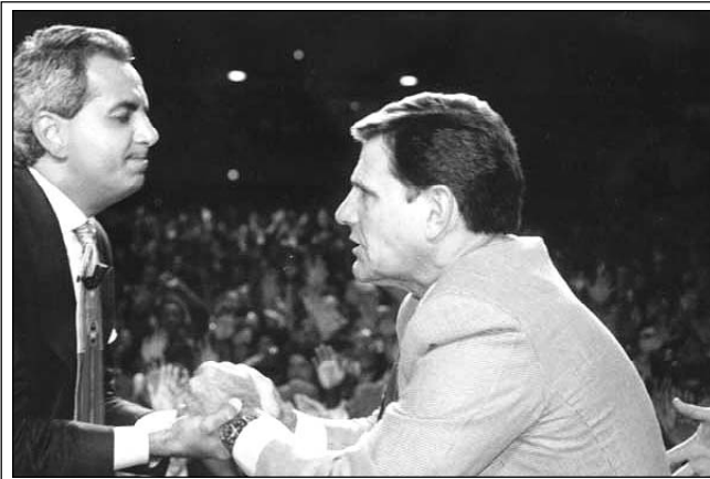
Бенни Хинн и Кеннет Коупланд

Кроме того, хотя Бог действительно обещал избавить Своих, Он не обещал сделать это немедленно. Например, как мы читаем в Евреям 11:32-39, одни праведники верой одерживали великие победы, а другие верой переносили лишения. Тем