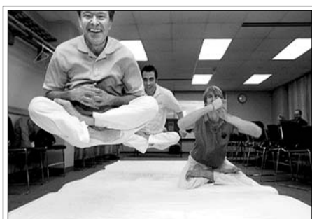
Знаменитые «полеты» йогов ТМ. На самом деле, это прыжки.

ние к состоянию сознания, именуемому Единством» ( What Everyone Should Know about Transcendental Meditation , 1975, p. 25). И далее: «Согласно диагнозу Махариши, наибольшая проблема человека заключается в отсутствии осознания своего собственного божественного Существа. Вместо того, чтобы достигать сознания Бога, люди пытаются быть добродетельными или просто думают о Боге» (там же, p. 23). Вот слова самого Махариши: «Все несчастья мира проистекают из непонимания этого единственного момента» (там же).