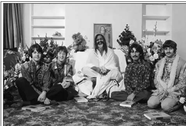
Махариши в окружении группы «Битлз»

Предпринятая Махариши в соответствии с Мировым Планом секуляризация ТМ оказалась успешной и укрепила позиции ТМ, позволив ей не стать очередным кратковременным увлечением.