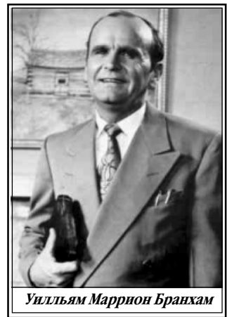
Уильям Маррион Бранхам