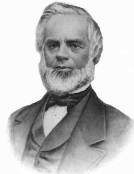
Финеас Паркхерст Куимби

о том, как стать богатым» говорит о мыслящей субстанции, из которой создано все сущее, и которая в первичном состоянии «пронизывает, проникает и наполняет все внутреннее пространство» 35 . Человек способен создавать предметы, внушая бесформенной субстанции свои мысли и заставляя ее воспроизводить то, о чем он думает. Для достижения желаемого результата необходимо настроиться на созидание и нарисовать себе четкий образ желаемого. Далее, Уоттлс совету-