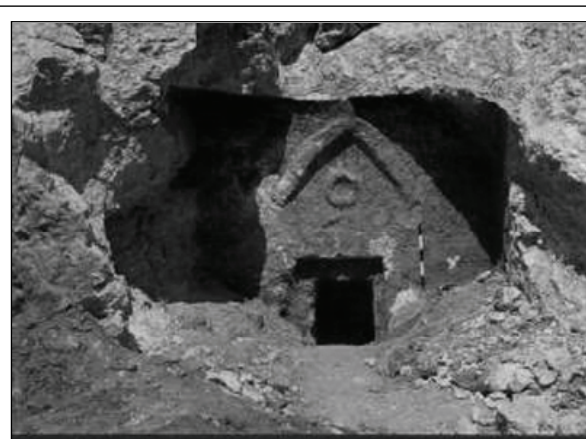
Внешний вид гробницы в Тальпиоте

Но даже если надпись окажется подлинной, а вариант «Йешуа-бар-Йосеф» — правильным, само по себе это обстоятельство ни о чем не говорит, поскольку имя «Йешуа» было найдено на 22 оссуариях, причем в четырех случаях надпись выглядела как «Йешуа-бар-Йосеф».